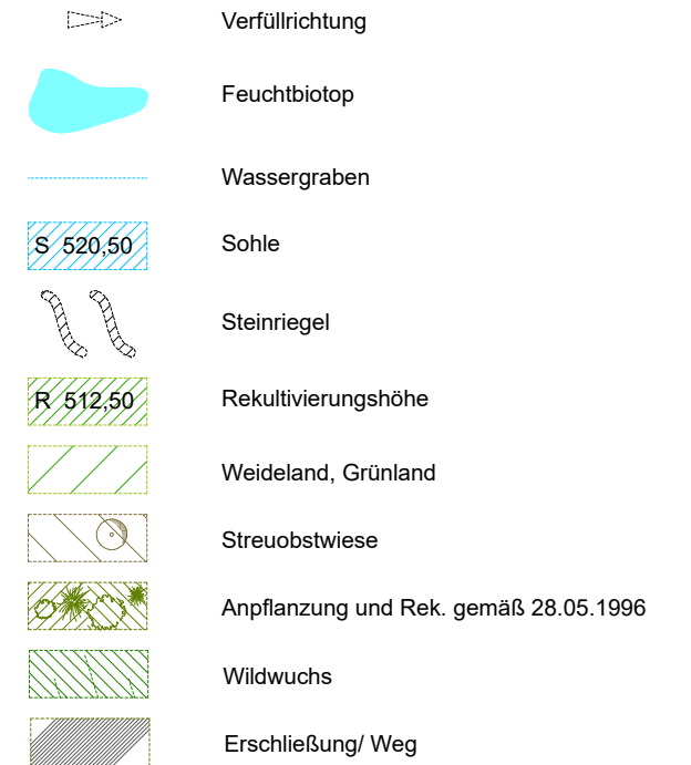
Übersichtsplan: ohne Maßstab